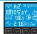
Izgled LCD zaslona s funkcijama